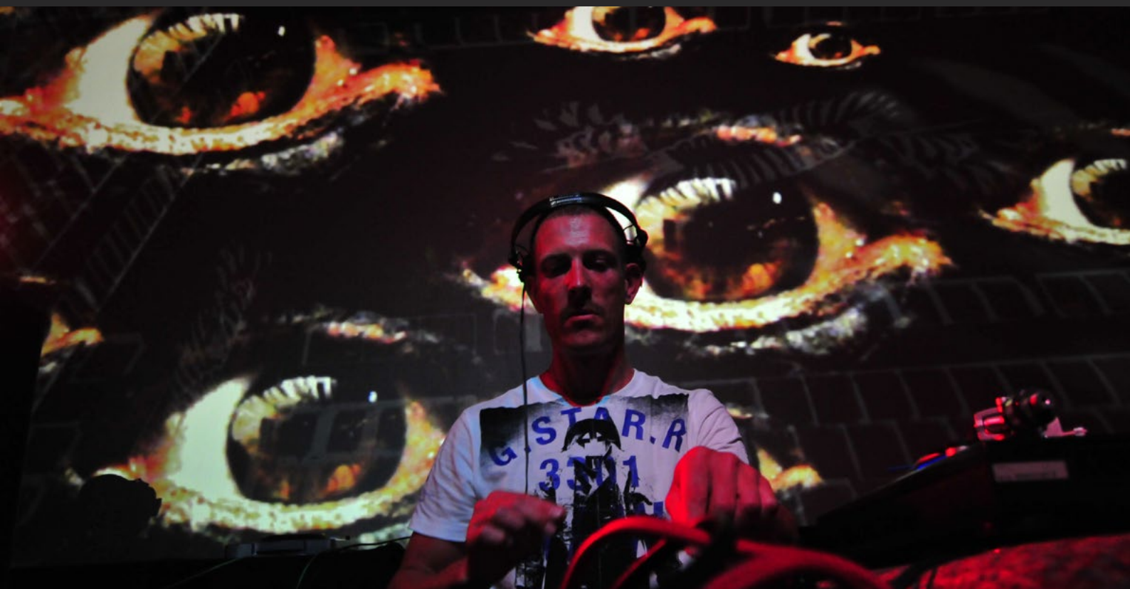
mit.ein.ander | Equaleyes | Digital | Planetarium | Wien 2010 | Live visuals, Raumprojektion | Foto : Osaka