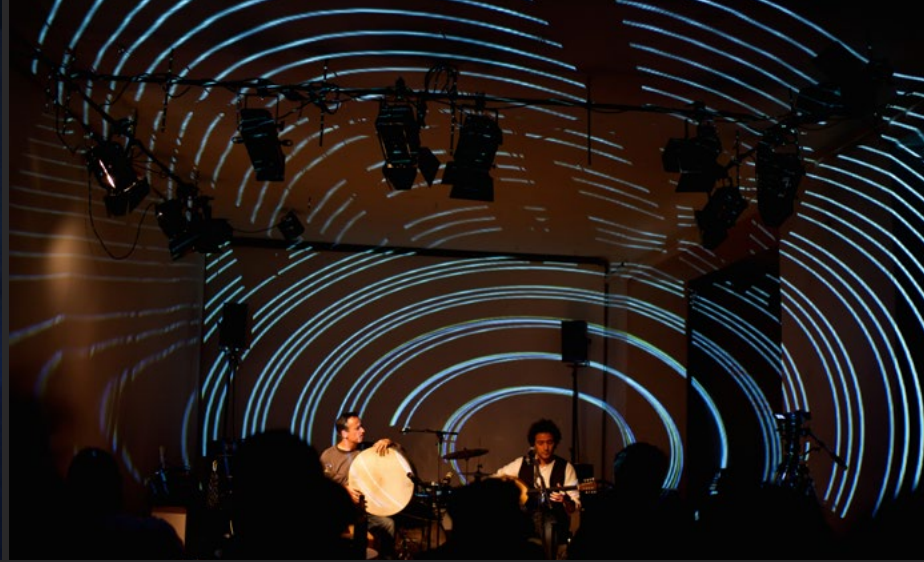
Shut up and listen | Echoraum Wien 2015