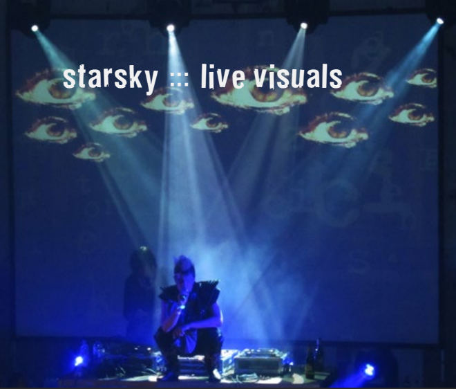
Femous | Peaches | Wien 2010