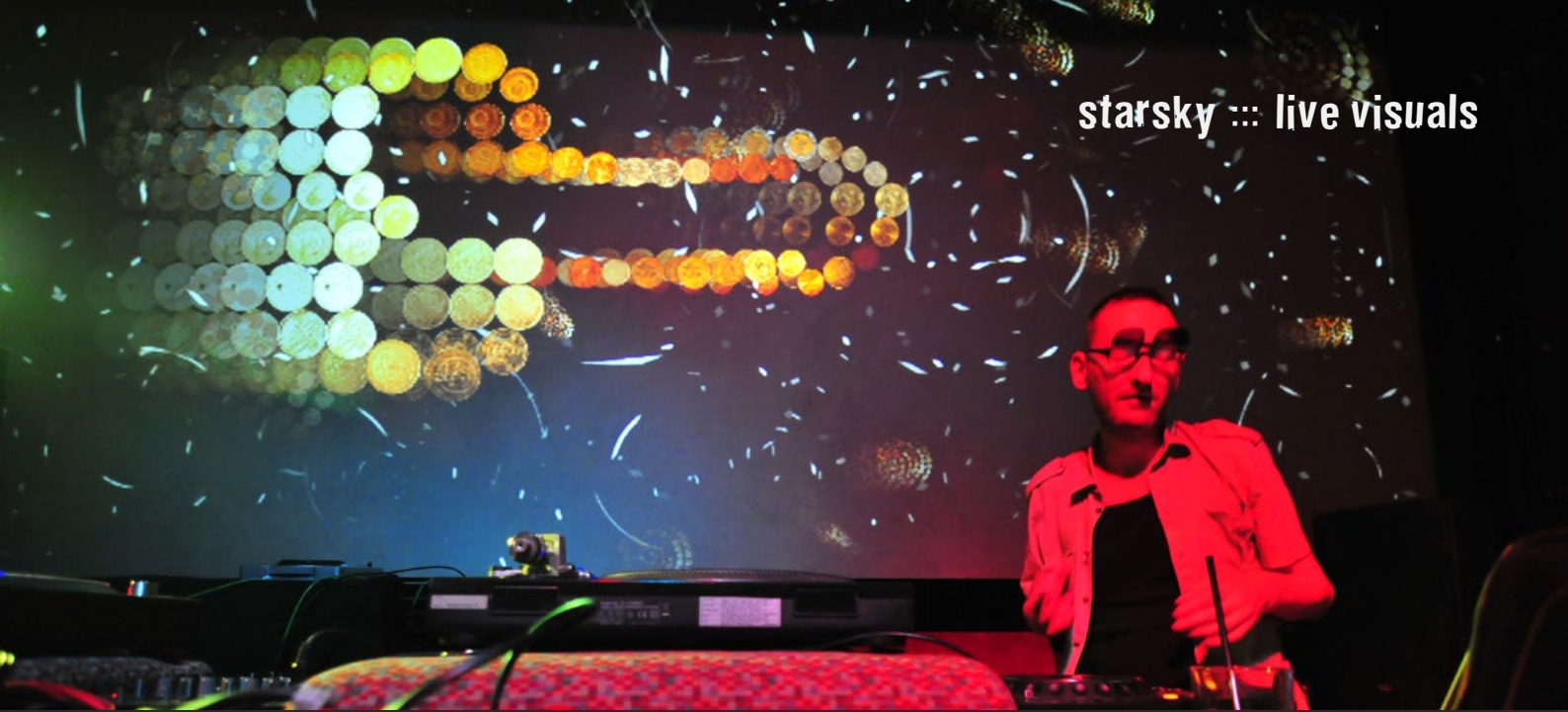
mit.ein.ander | Equaleyes | Digital | Planetarium | Wien 2010 | Live visuals, Raumprojektion | Foto : Osaka