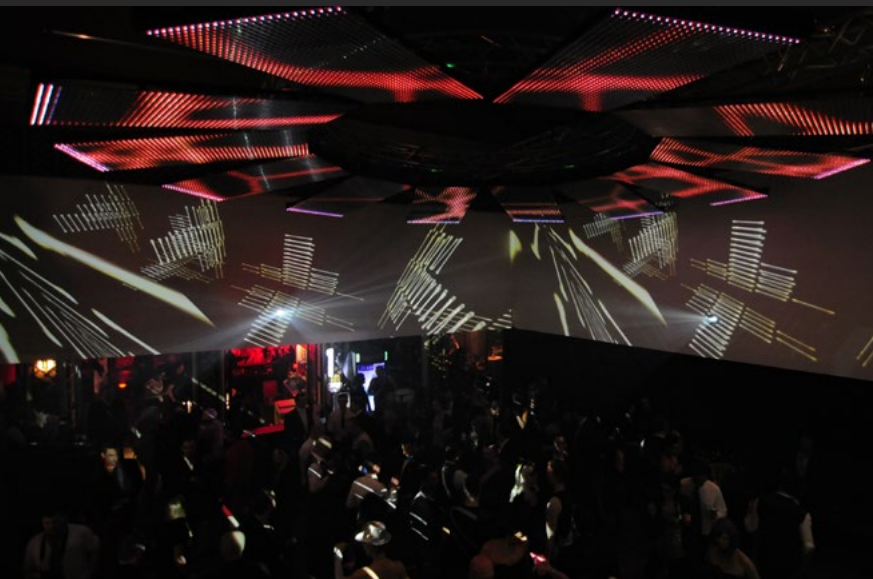
Rosenball 2010 | Palais Auersperg Wien