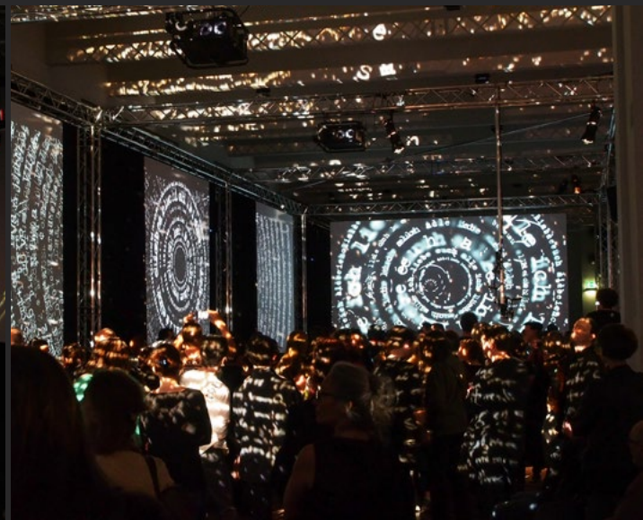
starsky manifest | MAK Wien 2015