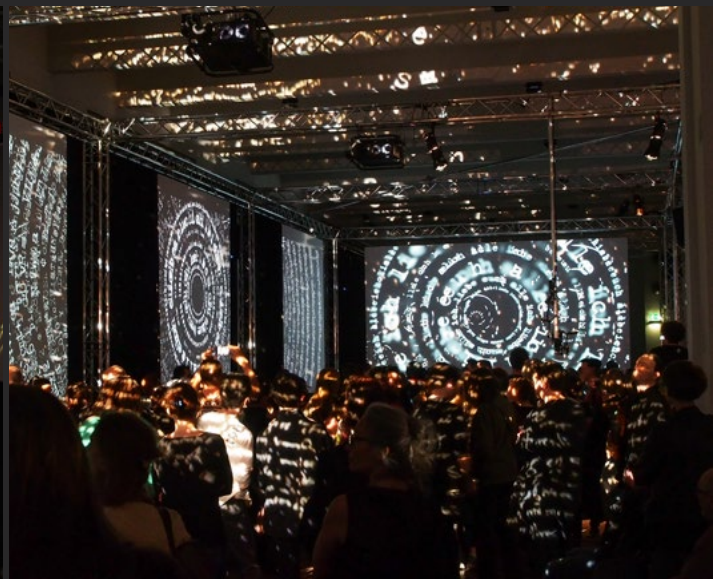
starsky manifest | MAK Wien 2015