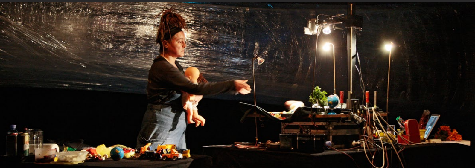
Die Kinder der Toten | Elfriede Jelinek | QUER Festival | Odeon Wien 2010 | Foto : Klaus Vyhnaek