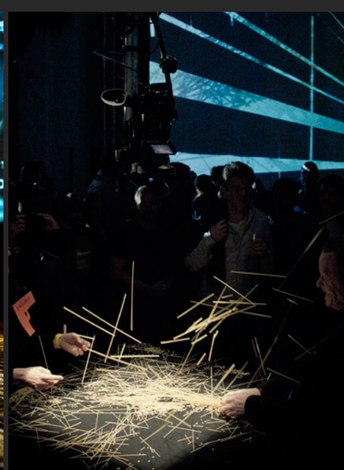
starsky manifest | sound:frame Festival | MAK Wien 2015 | Live camera, Live visuals, Raumprojektion | Fotos : Osaka