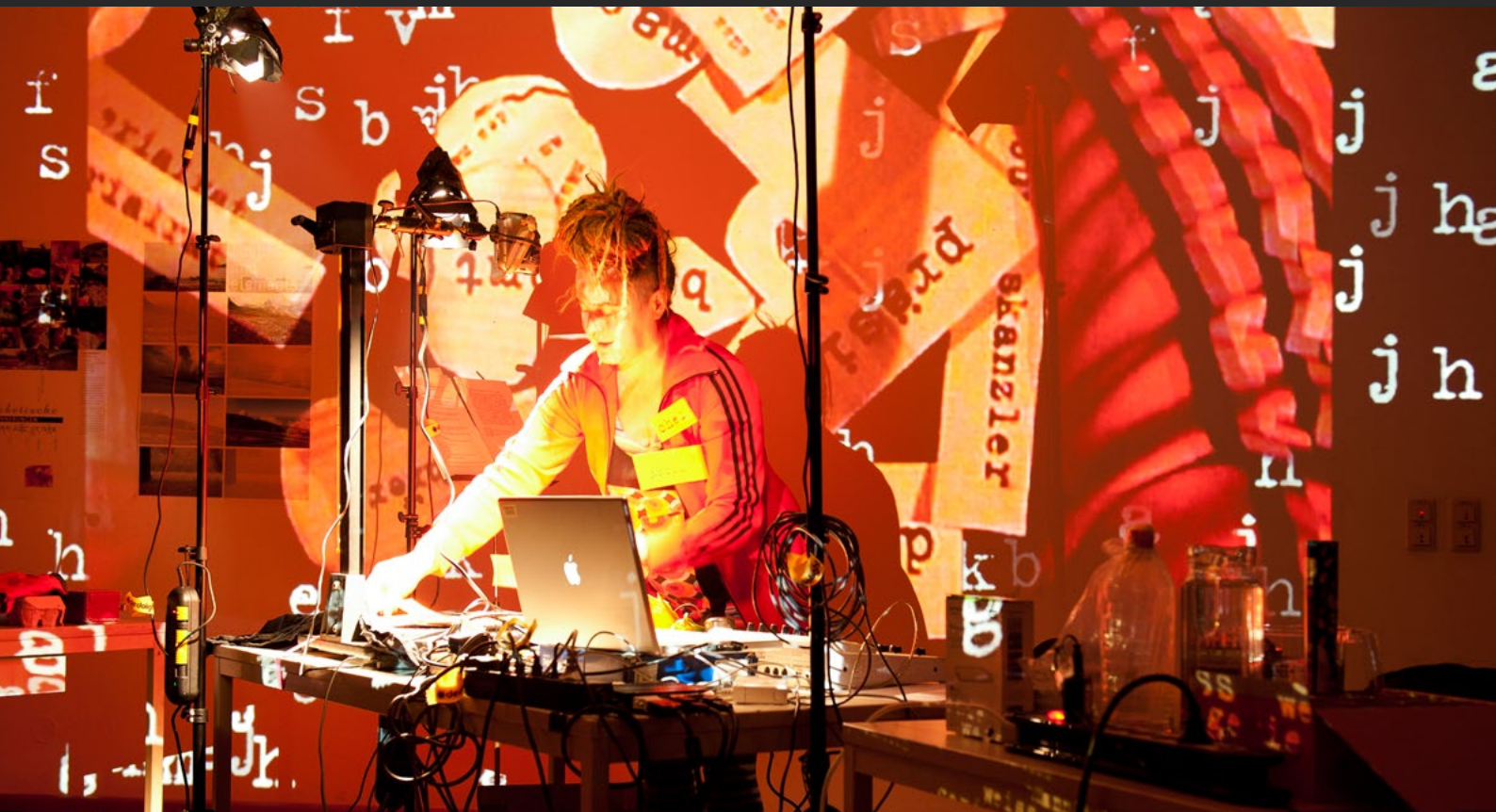
Widerstand | Abteilung Zeitbasierte Medien | Kunstuniversität Linz | 2011 | Live Video Lecture