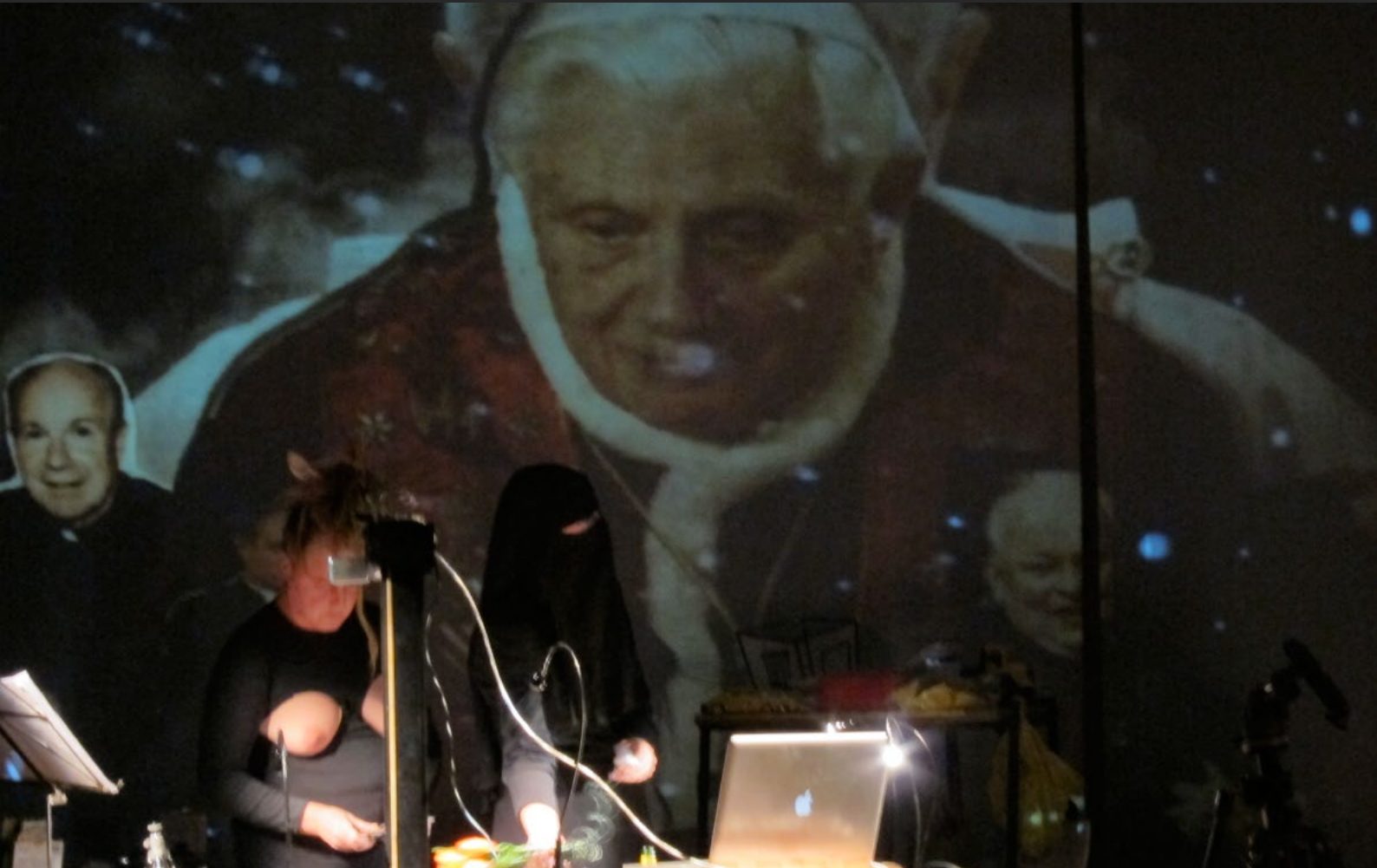
Art, visual & poetry Festival | 3Raum Anatomietheater | Wien 2011 | Live Cam Performance