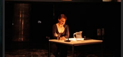
Zeitsalon | Wien 2010 | Live Cam Performance