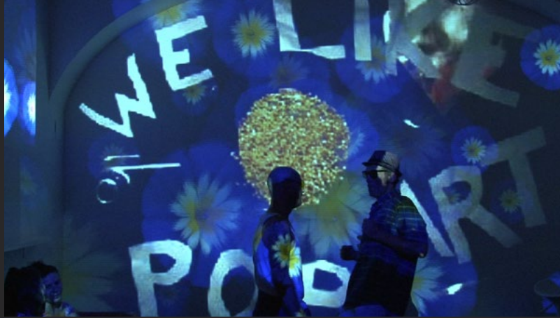
Zeitsalon | Wien 2010 | Spielzeug, Live Camera- Live Cooking-Performance | Videoscreenshots : Harald Winkler, starsky