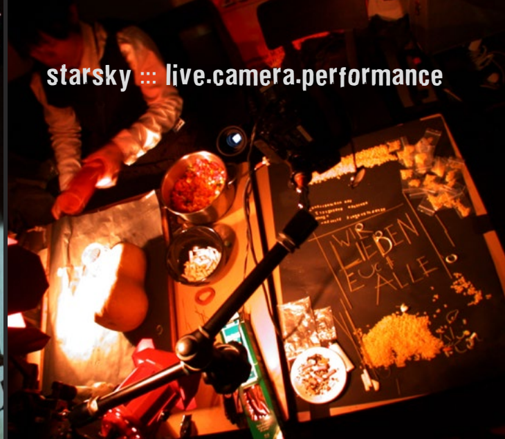
starsky :: live.camera.performance